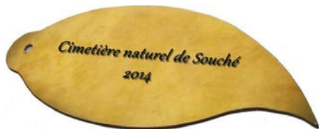
Feuille à graver au nom du défunt