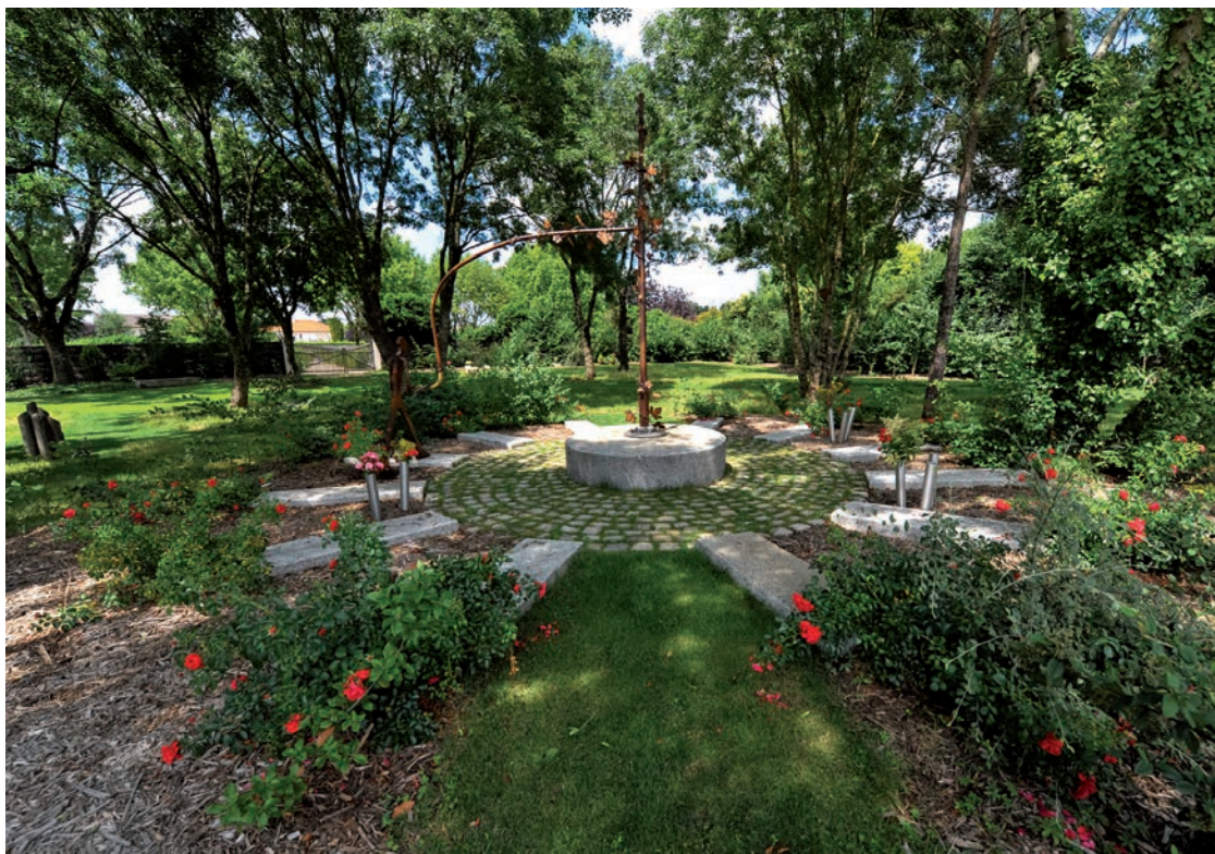
Jardin du souvenir