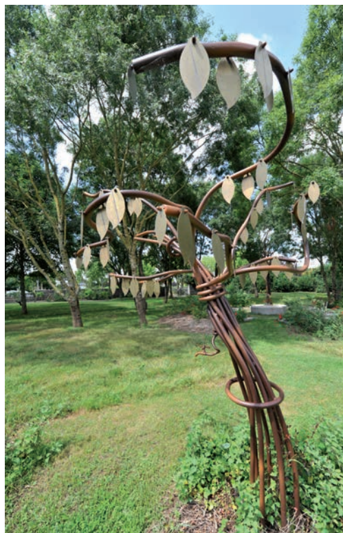
Arbre de printemps

Le jardin du souvenir offre la possibilité de procéder à la dispersion des cendres d'un défunt sans matérialisation de l'espace, si ce n'est par une feuille symbolique en laiton fournie par la Ville de Niort, gravée au nom du disparu et suspendue dans l'Arbre des Printemps. Ce geste, comme celui d'enfouir les cendres et de les recouvrir d'un broyat, est réalisé par un agent municipal. Seules des fleurs naturelles coupées peuvent y être déposées, aucun autre fleurissement ou objet funéraire n'est autorisé.